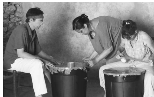
Poubelle et scotch : La fabrication d'un tambour...