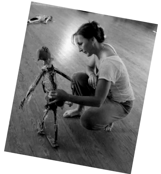
Les systèmes : le squelette ...

Structuration Psychocorporelle et danse-thérapie /